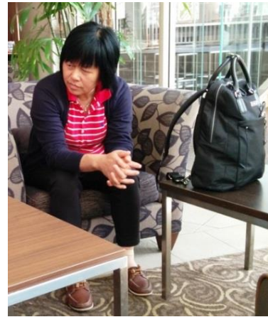
陆太太，桌上放着那高档的情侣双肩包。

旅行团里有来自嘉定的四对夫妻一起参团，他们行动一致，白天一起游玩，吃饭坐在一桌，晚上一起外出赌博，很引人注目。八个成年人能如此抱成一团旅游，其中一定有位组织者。