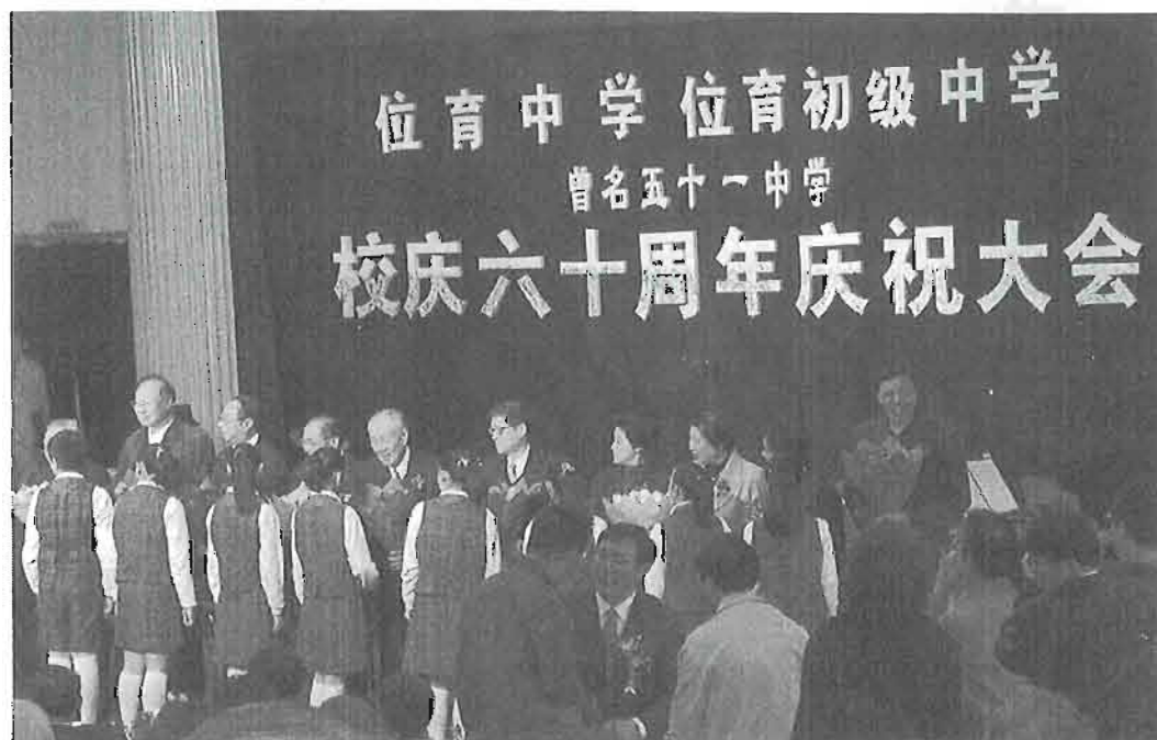
校庆六十周年庆祝大会上，学生向历任校领导献花。（宓哲新供稿）

高穹广厦任徘徊，回首夕阳红小宅。 一代钟声依旧响，六旬桃李正当开。 已达良治行周礼，更拓宏疆造楚材。 母校双园莲并蒂，赵钱孙李慕名来。