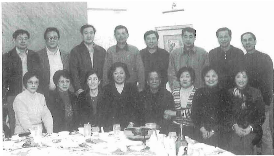
51中男女排球队员小聚

二个多小时的聚餐会在穿插交谈、朗朗笑声中很快就结束了，餐桌上虽然没有山珍野味，但是经尽情的回忆谈笑，却使满座生辉，回味无穷。