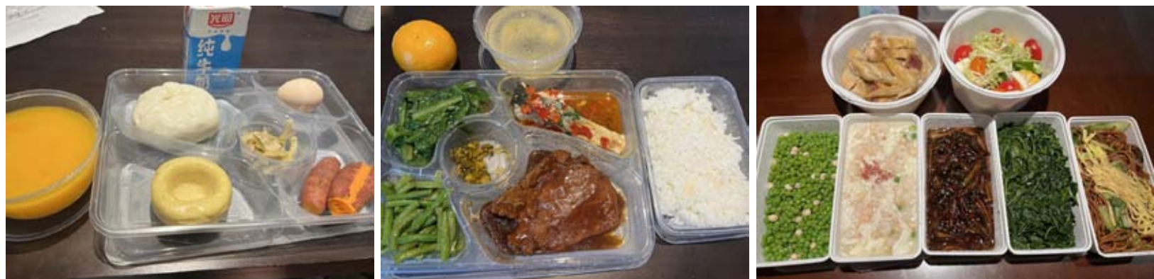
12/20日，结束5天隔离，在隔离酒店的早餐，午餐；和回家后“上海会馆”的外卖晚餐

开始居家自我隔离三天。今天晚餐，外卖小区对面“上海会馆”，快递小哥准时送到家还是热乎乎的美食，满足了味蕾，更是一种浓浓的家乡“情结”。