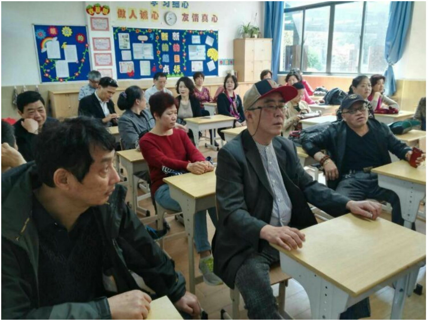
等迟到同学，等“老师”上课，有点无聊：看手机、打盹、发呆、傻笑。