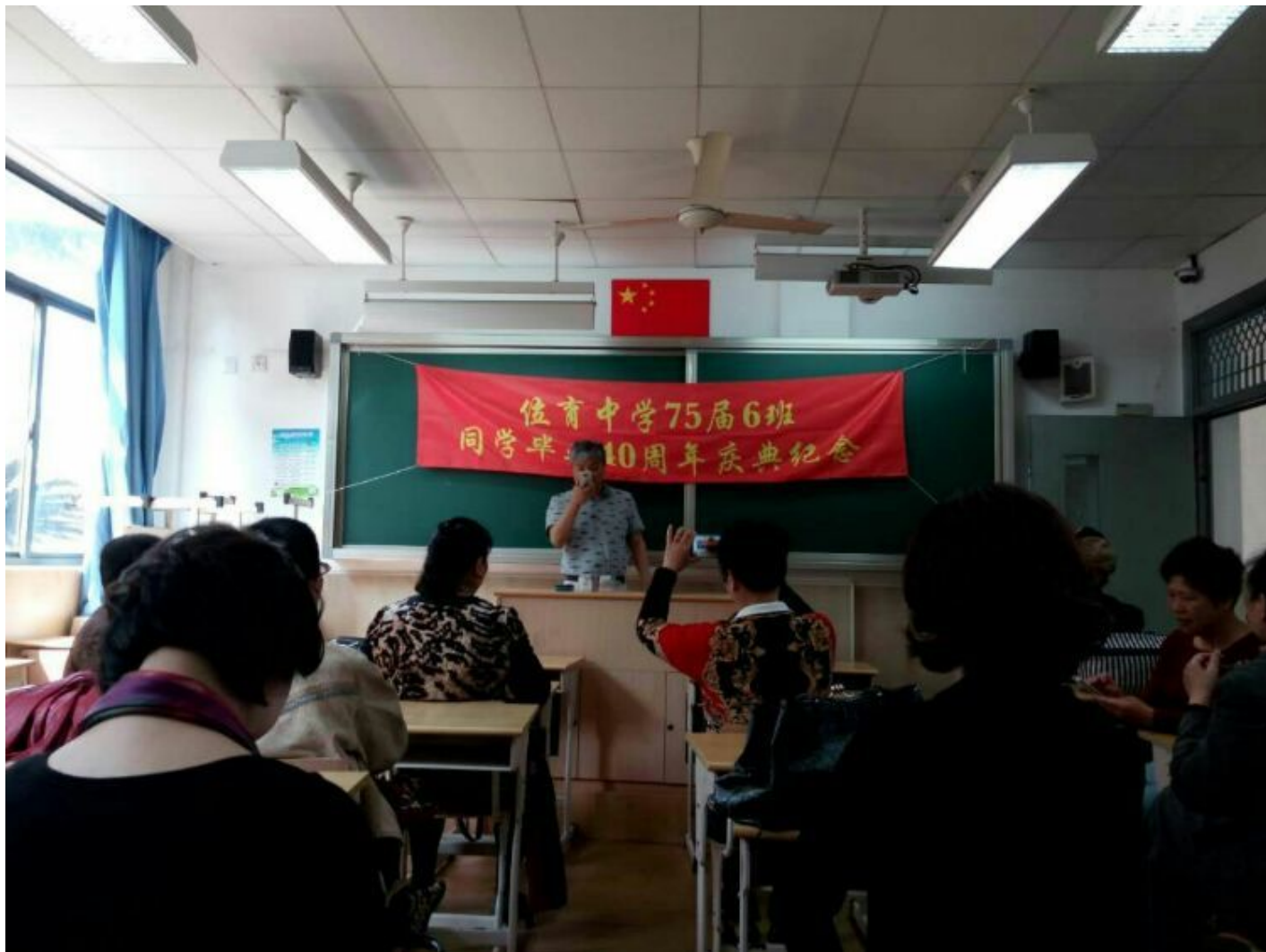
拍照，相互拍照，记录下美好开心的时刻。