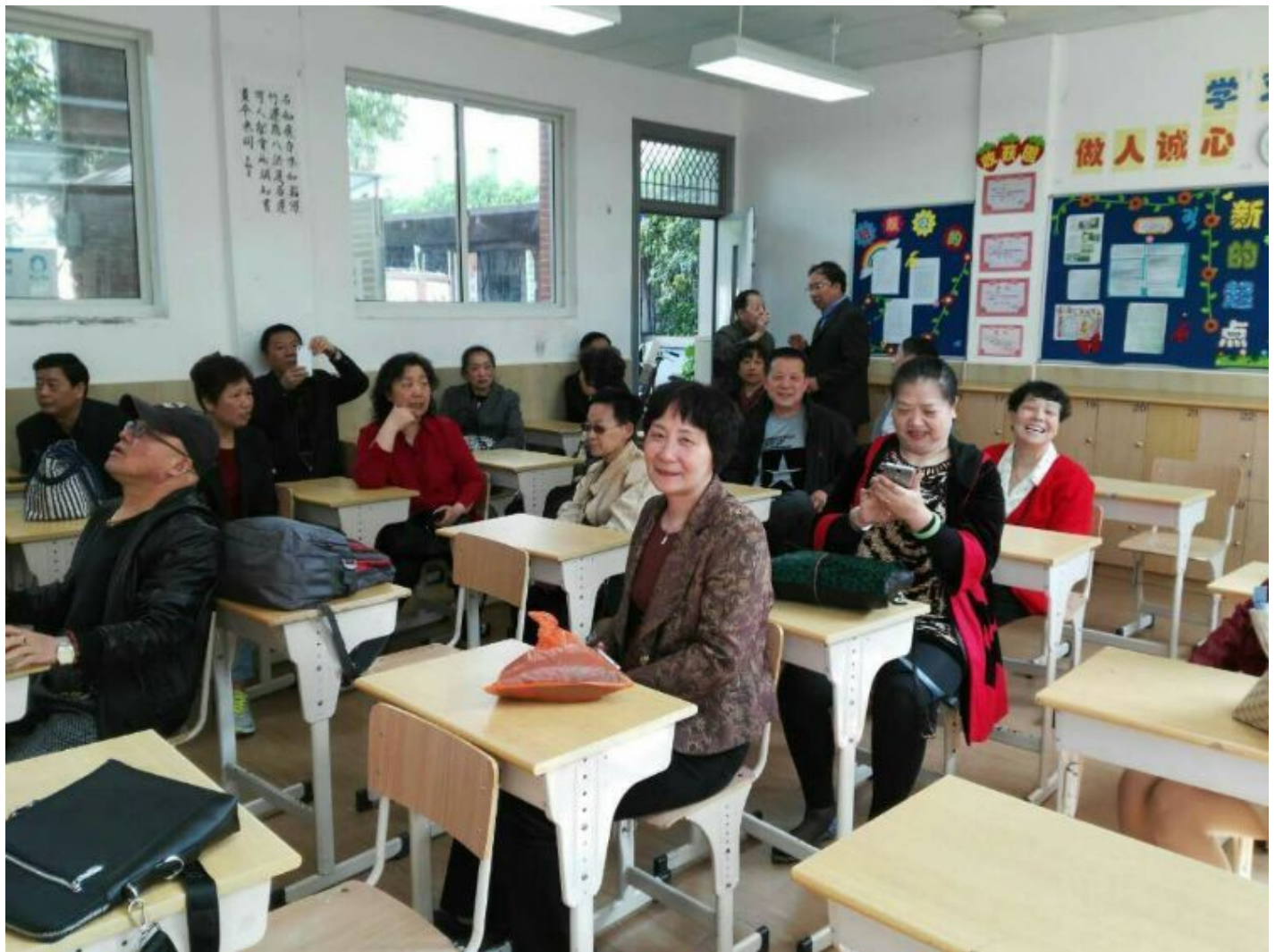
先拍几张照片先看几段微信吧，当年可没有手机，家里也没有固定电话，传呼电话也要省着用。