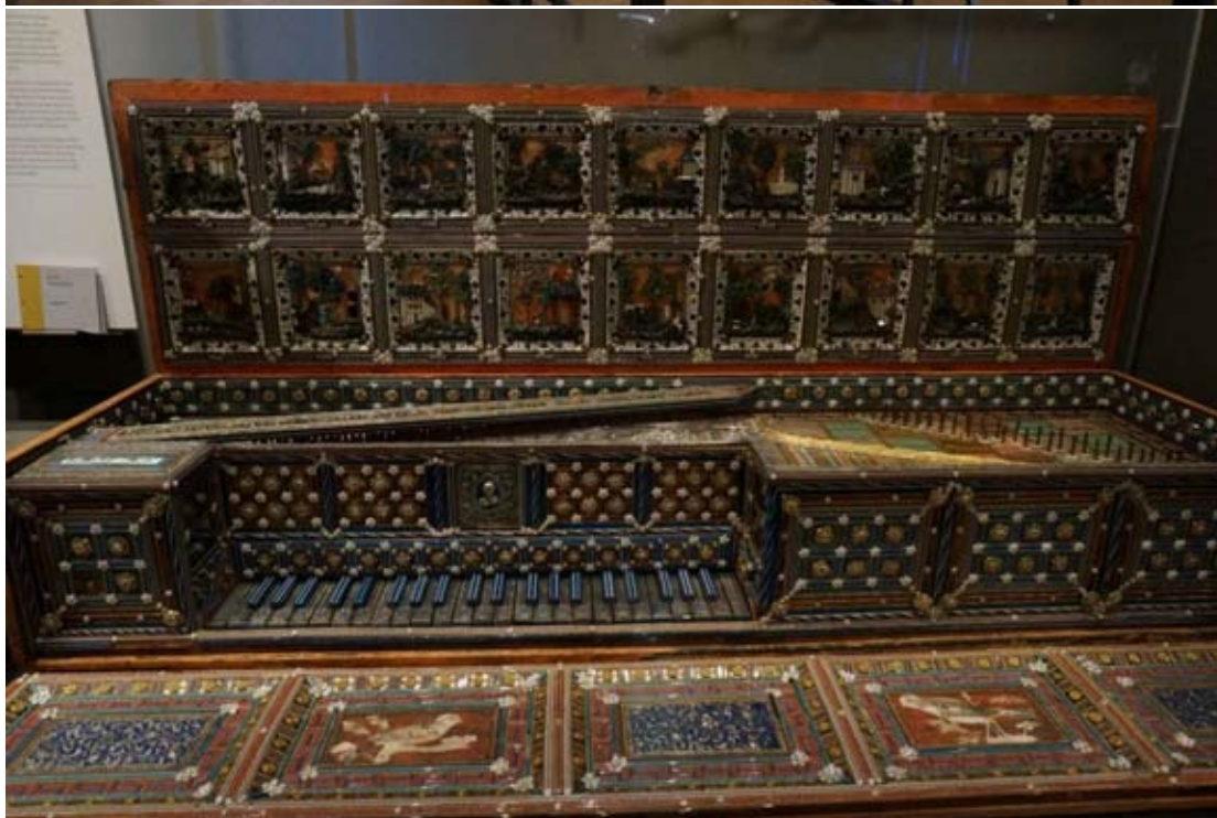
制造于 1580-1600 年的大键琴。