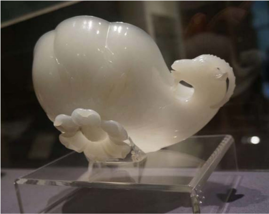
沙贾汗的酒杯，杯子的底座是一朵花，杯身呈漩涡状，手柄是一个山羊头。这是来自印度的白玉杯，制作于 1657 年。