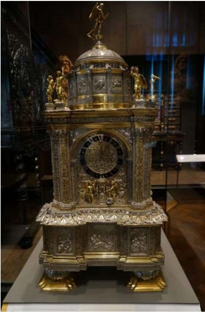
荷兰钟，制造于 1665-1670 年