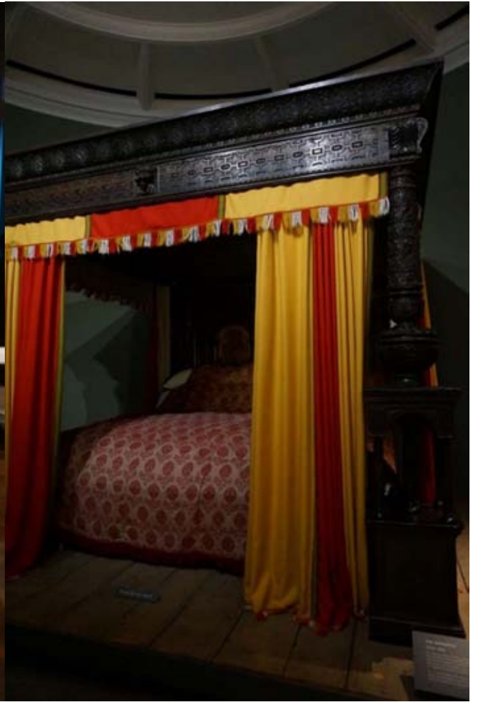
英国大床，制造于 1590-1600 年