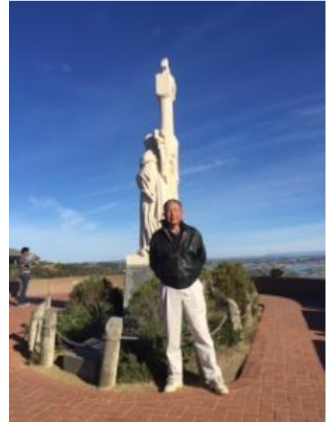
我们不也是一样目标清晰？