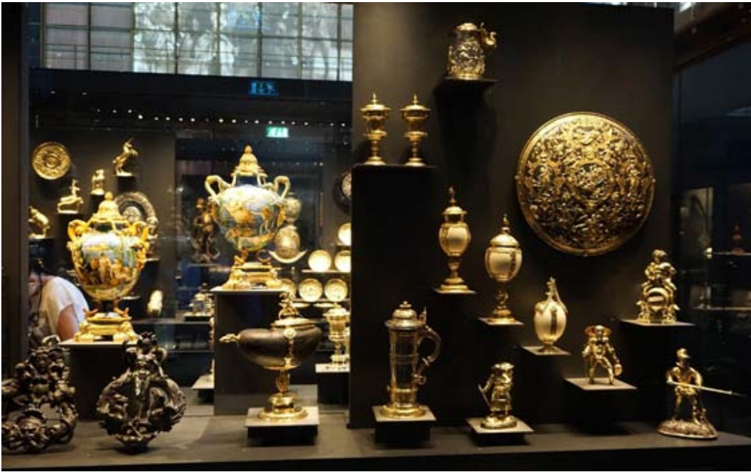
以下六张照片是启蒙运动馆以及里面的展品。